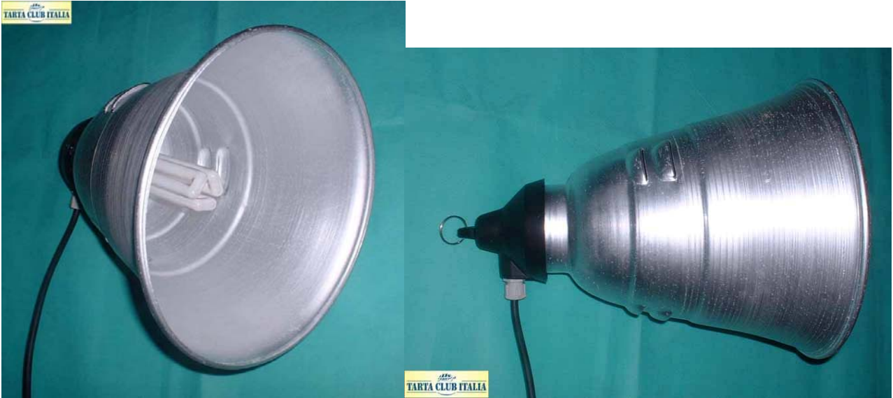
Riflettore in alluminio, utilizzato per i test.