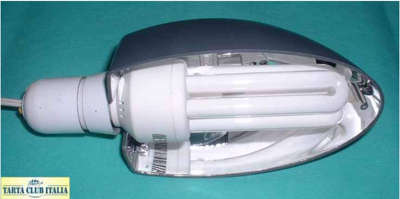
Riflettore ARCADIA, utilizzato per i test.